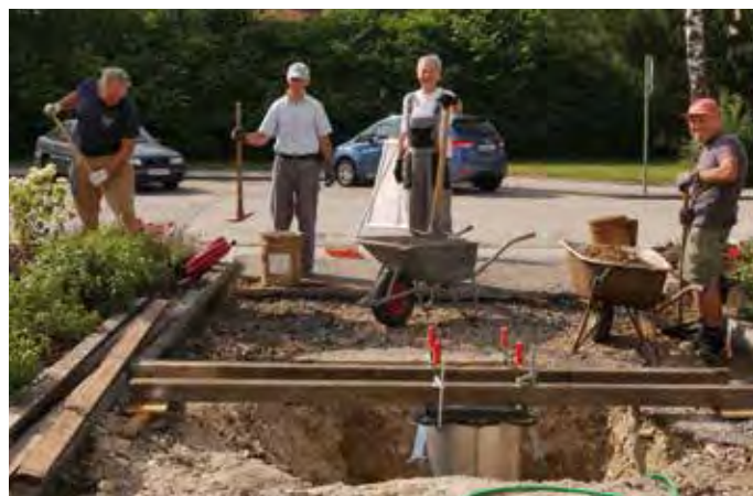
Fleißige Ehrenamtliche - trotz Hitze und Sommerferien auf der Baustelle

Vielen Dank allen Pfarrmitgliedern, die immer wieder, sei es durch Spenden oder ihre tatkräftige Mithilfe, unsere Bauvorhaben unterstützen!