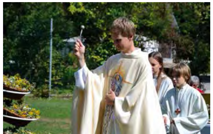
Die Kräuterbuschen werden gesegnet

Deshalb ist es Brauch, dass am Ende des Gottesdienstes Kräuterbuschen gesegnet werden. Diese sollen vor Krankheit und Unglück schützen.