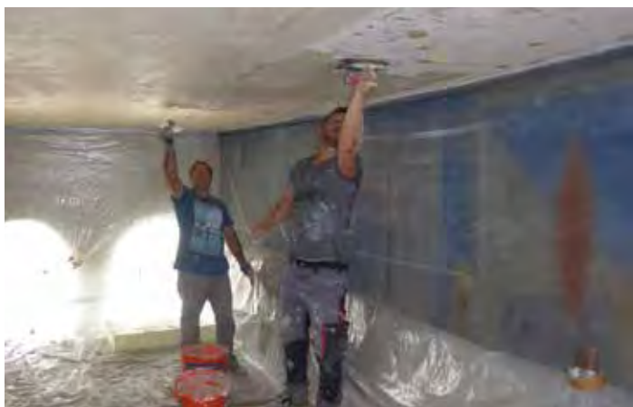
Vom Kirchenraum aus war der Schaden kaum zu sehen