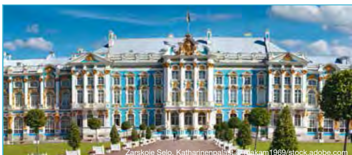
Zaroskoje Selo, Katharinenpalast