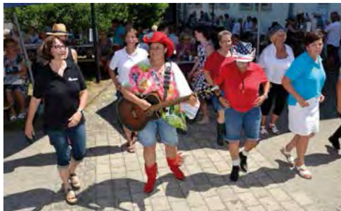
Ein Fest zum Mitmachen

Ein wirklich tolles Fest – da waren sich alle Besucher einig.