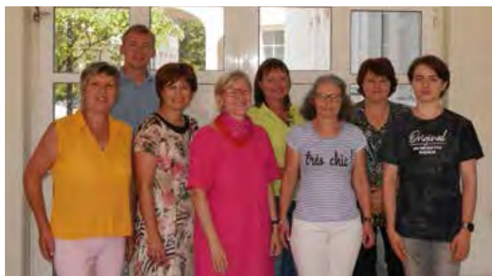
das neue Pfarrblattteam

Auch inhaltlich gibt es einige Neuerungen. Das Pfarrblatt wurde neu strukturiert, die Inhalte erweitert. Für unsere Jüngsten gibt es ab sofort eine Kinderseite, auch Spirituelles, Mundartgedichte und Kulinarisches werden Sie u. a. künftig zum Thema begleiten. Viel Spaß beim Lesen!