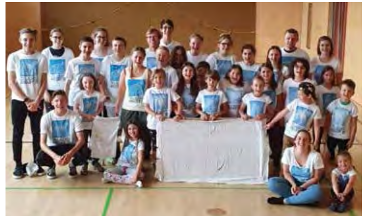
Vogelweider Forschergruppe am Weg zum Nordpol