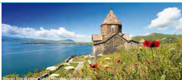
Sewan See