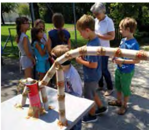
Bau einer Kugelbahn aus Klopapierrollen