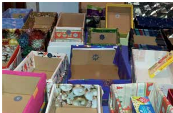
Die leeren Geschenkschachteln möchten gerne befüllt werden

Im Foyer der Kirche steht auch heuer wieder ein leerer Adventkalender, der bis kurz vor Weihnachten gefüllt werden möchte. Bitte unterstützen Sie uns mit haltbaren Lebensmitteln und Hygieneartikeln. Damit können wir bedürftigen Menschen unserer Pfarre eine kleine Freude bereiten.