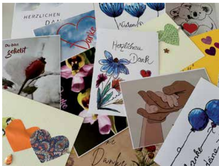
Bis Weihnachten liegen Karten zur freien Entnahme zum Mitnehmen und Verschicken auf.

Wir hoffen, dass diese Impulse dazu beitragen, dass sich viele auf den Weg machen, um Lichtbringer und Lichtbringer*innen für die Menschen zu werden!